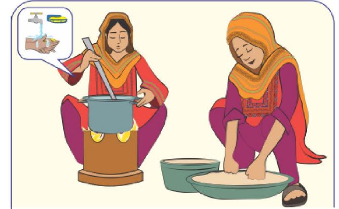
اتو ڳوھڻ ۽ کاڌو پچائڻ کان پهرئين