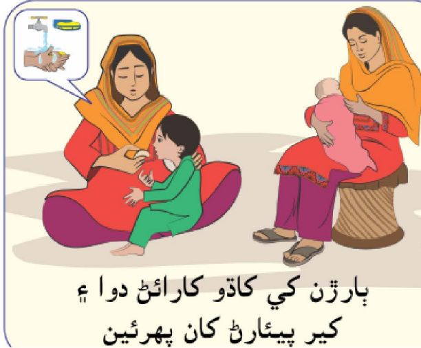
بارڙن کي کاڌو ڪرائڻ دوا ۽ کير پيئارڻ کان پهرئين

Programme for Improved Nutrition in Sindh (PINS) has produced SBCC Toolkit with financial support from European Union. SIGN Project used this SBCC toolkit to develop IEC Material for project awareness