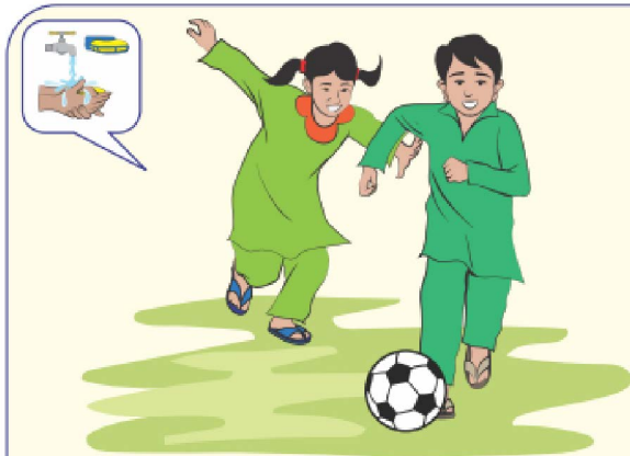
رانڊ روند ڪرڻ کانپوءِ