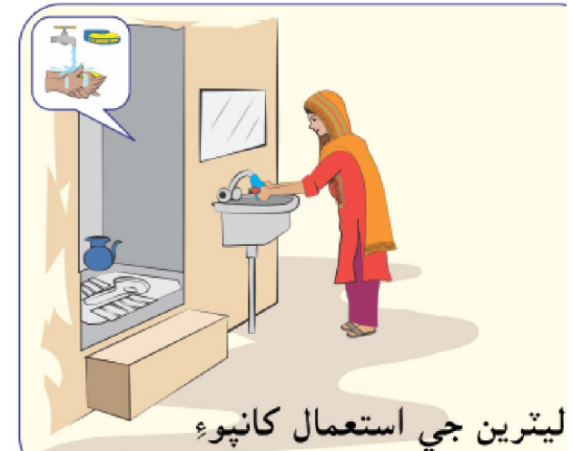
ليٽرين جي استعمال کانپوءِ